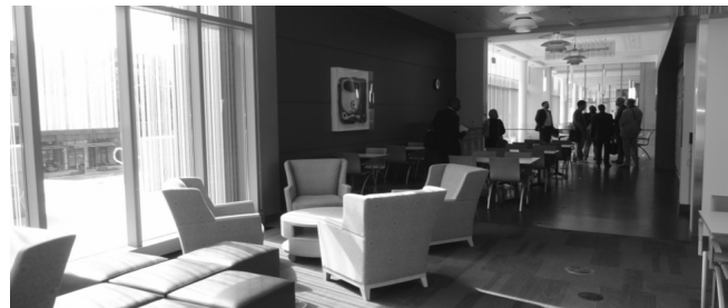
Obrázok 5 Relaxačná zóna

Bola to najväčšia doterajšia investícia školy (55 mil. USD). Stará budova Lemieux Library z roku 1966 bola prestavaná a doplnená o priestor pre McGoldrick Learning commons.