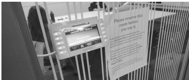
Obrázok 6 Možnosť rezervácie miestnosti na štúdium

Pre štúdium je k dispozícii 15 skupinových miestností, v ktorých sa dá prostredníctvom rezervačného panelu na miestnosti alebo prostredníctvom webu rezervovať čas na štúdium, ďalej čítárne a miestnosti na individuálne štúdium a 6 konzultačných zón, tzv. „consulting cubicles“, ktoré sa nachádzajú v blízkosti príručných fondov, kde zároveň nájdu pomoc knihovníkov alebo konzultantov z radu študentov.