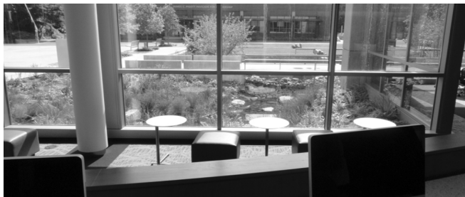
Obrázok 4 Budova Lemieux Library je v príjemnom prostredí.

V roku 2010 v kampuse v Seattli otvorili novú budovu Lemieux Library ( http://www.seattleu.edu/library/ ), projektovanú ako tzv. zelenú stavbu so systémom úspornej klimatizácie a recyklácie vody.