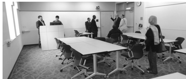
Obrázok 7 Učebňa ako súčasť knižnice

V budove knižnice sa nachádzajú aj učebne zariadené nahrávacími a didaktickými technológiami. Pre študentov žurnalistiky je k dispozícii rozhlasové a televízne štúdium a auditorium na prezentáciu.