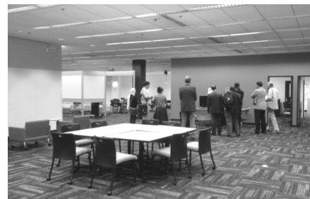
Obrázok 1, 2, 3 – learning commons na University of Washington – priestory na kolaboratívne štúdium

Na webovej stránke univerzity nájdu študenti stránky o learning commons ( http://commons.lib.washington.edu/ ), prostredníctvom ktorých si môžu tiež rezervovať niektorú z miestností, získať informácie o ponúkaných technológiách, o priestoroch a nájsť pomoc konzultantov.